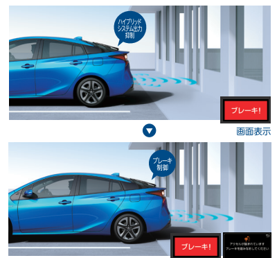
画面表示(システム作動により車両減速)