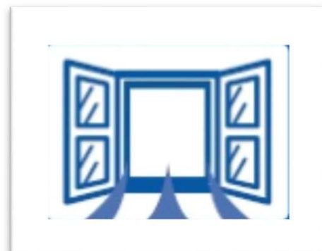
ショールームの換気と 時短商談