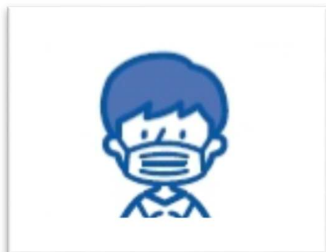
不織布マスク着用

お客様と社員の感染予防と安全を確保する為の対応として 下記の対策を徹底いたします。 お客様のご理解とご協力をお願いいたします。