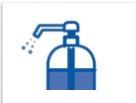
手指と設備の消毒