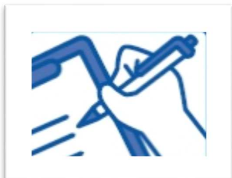
連絡先の確認と記録